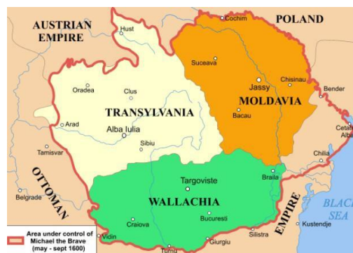
Foto Nr. 6. Harta principatelor românești sub Mihai Viteazul la 1600