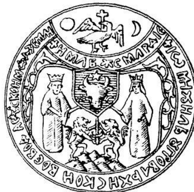
Foto Nr. 3. Sigiliul lui Mihai Viteazul, 1600