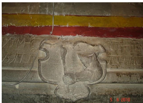
Foto Nr. 5. Pisania Bisericii din Teiuș și blazonul familiei Racz de Gálgo